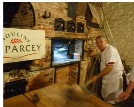
... ainsi que tous nos boulangers !!! Merci à eux !!!