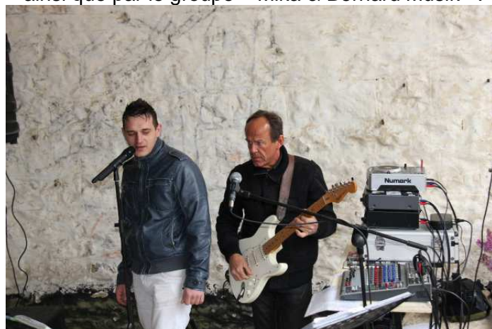
Encore une belle journée pour notre Fort et ses nombreux visiteurs...