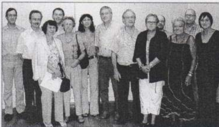
Les acteurs de ces deux journées ont présenté un programme riche et varié.

Les partenaires associatifs des Journées européennes de la culture avaient rendez-vous la semaine passée pour faire le point sur le programme qui attend les amoureux d'art et d'histoire ce week-end à Héricourt. La médiathèque, le musée Minal, la Tour du Château, le temple, le fort du Mont-Vaudois seront ouverts au public pour des visites et des expositions. À la médiathèque, l'exposition En voiture! Japy et